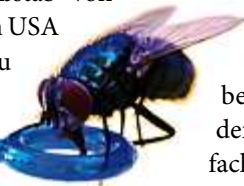
Gestatten, Lucilia sericata .

Von vielen Kulturen und zu ganz verschiedenen Zeiten wurde das Wissen um den positiven Einfluss von lebenden Fliegenmaden auf die Heilung von Wunden genutzt. Hierzu gehören die australischen Aborigines ebenso wie die südamerikanischen Maya, die mit Tierblut getränkte Tücher in die Sonne legten, damit Fliegen zur Eiablage einluden, und die aus den Eiern schlüpfenden Larven auf schlecht heilenden Wunden einsetzten. In unserem Kulturkreis beobachtete man seit dem Mittelalter, dass von Maden befallene Wunden von Kriegsverletzten abheilten. Französische und amerikanische Militärärzte berichteten über verblüffende Erfolge der unappetitlichen Behandlung. In den 1930er Jahren wurden Fliegenmaden im kommerziellen Maßstab von der Firma Lederle in den USA produziert – bis den neu