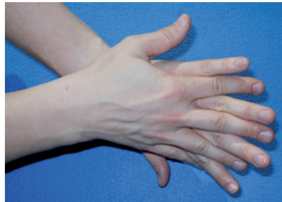
Abbildung 2 Rechte Handfläche auf linken Handrücken legen, Finger spreizen und verschränken, dann reiben – und umgekehrt.