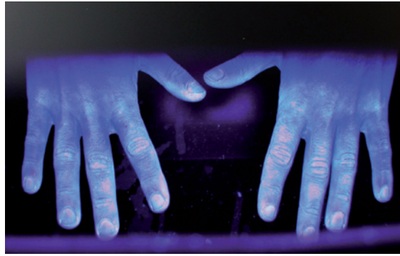
Abbildung 8 Erfolgreiche Händedesinfektion.