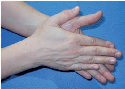
Abbildung 1 Handfläche auf Handfläche reiben.