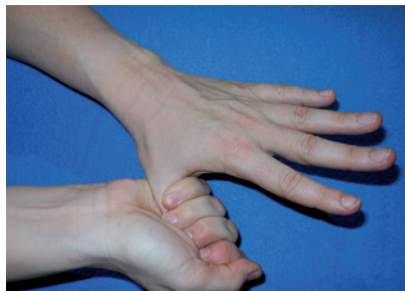
Abbildung 5 Mit der rechten Handinnenfläche den linken Daumen fassen und kreisend einreiben – und umgekehrt.