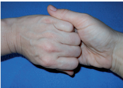
Abbildung 4 Außenseite der verschränkten Finger auf gegenüberliegende Handfläche legen und reiben.