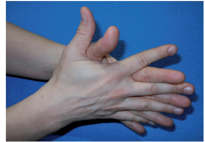
Abbildung 3 Handfläche auf Handfläche mit verschränkten sowie dabei gespreizten Fingern legen und reiben.